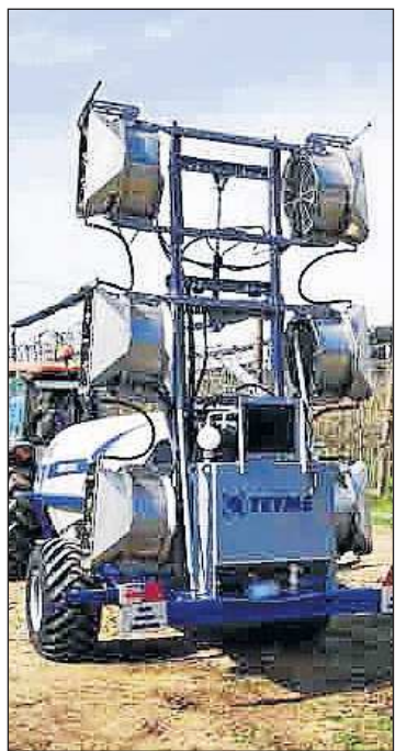
Màquina polvoritzadora de l'empresa TEYME dedicada al cultiu.

La Unió Europea ha vist una oportunitat per innovar i treballar conjuntament amb nous reptes: "És un pla enfocat cap a la modernització de l'economia que és la neutralitat climàtica, les inversions verdes i digitals amb una economia basada en el coneixement i la digitalització. També hi ha una sèrie d'estímuls i ajuts als sectors més colpejats que els pot costar més enganxar-se en aquestes transformacions verdes i digitals", declara Laura Rahola, responsable de comunicació de la Representació de la Comissió